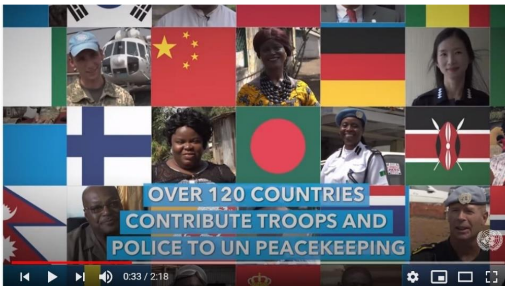
United Nations Peacekeeping: 70 Years of Service and Sacrifice

Se fx filmen: 70 years of service and sacrifice