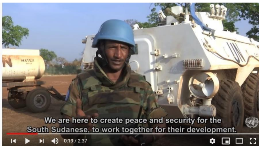
Service and Sacrifice: Peacekeepers from Ethiopia protecting communities in South Sudan

Se fx filmen Peacekeepers from Ethiopia protecting communities in South Sudan