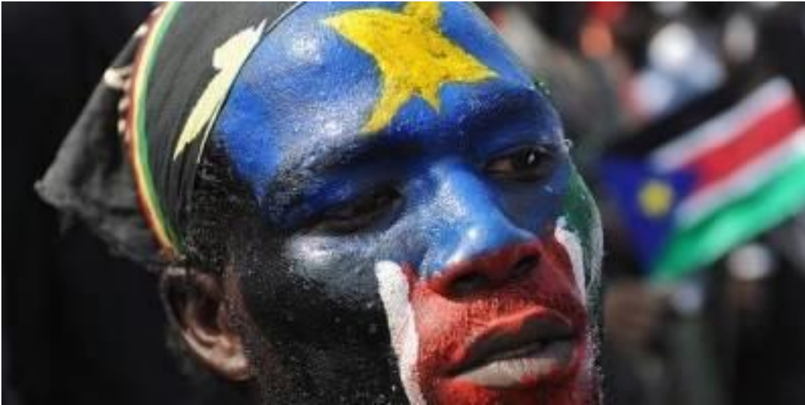
En sydsudaner malet med det sydlige Sudans flag i ansigtet for at fejre uafhængigheden i 2011