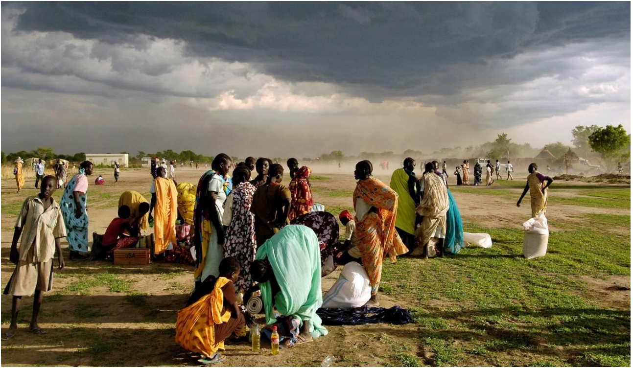
Der er mange internt fordrevne i Sydsudan, som modtager nødhjælp fra FN