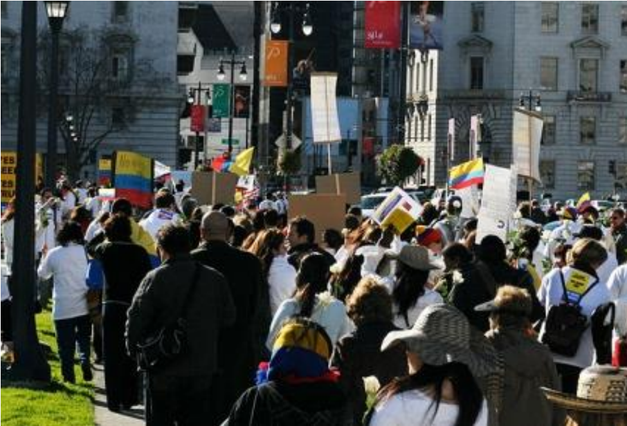
På vej mod fred