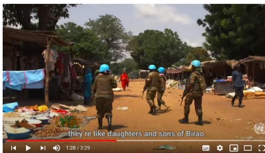
Zambian Female Peacekeepers in the Central African Republic

En del af disse film viser, at FN soldaterne beskæftiger sig med meget andet end fred og sikkerhed. Fx katastrofehjælp, gratis lægehjælp, dyrlæge ekspertise, beskyttelse af og kontrol med menneskerettigheder, sikring af humanitær hjælp, afvæbning. Samtidig med at de fungerer som rollemodeller. Se fx denne film