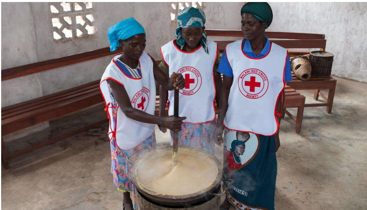
Røde Kors skolemad

I Røde Kors arbejder vi på at lave forberedende arbejde for at forhindre sult og hungersnødskatastrofer. Men hvis katastrofen rammer, er vi klar til at hjælpe med mad og vand. Vi uddeler mad til skolebørn, fødevarepakker til familier og penge til de sultende steder, hvor der er mad at købe, og vi arbejder med at udbrede kendskabet til bedre afgrøder og dyrkningsmetoder. Læs mere