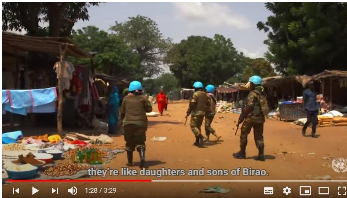
Zambian Female Peacekeepers in the Central African Republic