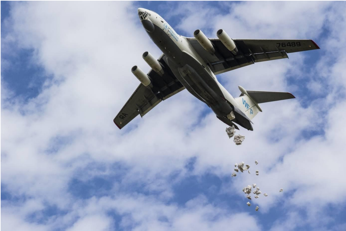
Et fly fra WFP dumper nødhjælp over Bentiu, Syd Sudan.